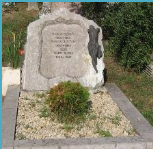
Elhunyt 25 éve 1994